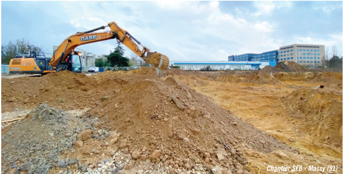
Chantier SFB - Massy (91)

L a SFB (Société Francilienne du Bâtiment), entreprise de bâtiment spécialisée dans la démolition, le terrassement et le voile contre terre, a sollicité Yterres pour évacuer les terres de son chantier situé au 15 rue Ampère à Massy (91).